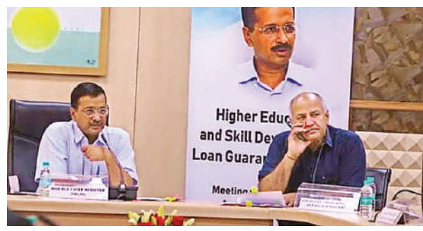
ਸਕੀਮ ਜਾਰੀ ਕਰਨ ਸਮੇਂ ਦਿੱਲੀ ਦੇ ਮੁੱਖ ਮੰਤਰੀ ਤੇ ਸਿੱਖਿਆ ਮੰਤਰੀ।

ਸਟਾਫ਼ ਰਿਪੋਰਟਰ, ਬਰਨਾਲਾ : ਦਿੱਲੀ ਉੱਚ ਸਿੱਖਿਆ ਤੇ ਕੌਸ਼ਲ ਵਿਕਾਸ ਗਰੰਟੀ ਯੋਜਨਾ ਦਿੱਲੀ ਸਰਕਾਰ ਨੇ 2015 'ਚ ਸ਼ੁਰੂ ਕਰਵਾਈ ਮੁੱਖ ਮੰਤਰੀ ਅਰਵਿੰਦ ਕੇਜਰੀਵਾਲ ਤੇ ਸਿੱਖਿਆ ਮੰਤਰੀ ਮਨੀਸ਼ ਕੁਮਾਰੀਆ ਵੱਲੋਂ 10ਵੀਂ ਤੇ 12ਵੀਂ ਕਲਾਸ ਦੇ ਵਿਦਿਆਰਥੀਆਂ ਨੂੰ ਕਾਲਜ 'ਚ ਪੜ੍ਹਨ ਲਈ 10 ਲੱਖ ਦਾ ਪੜ੍ਹਾਈ ਕਰਜ਼ਾ ਬਿਨ੍ਹਾਂ ਕਿਸੇ ਸ਼ਰਤ ਤੋਂ ਦੇਣ ਦਾ ਐਲਾਨ ਕੀਤਾ ਸੀ।